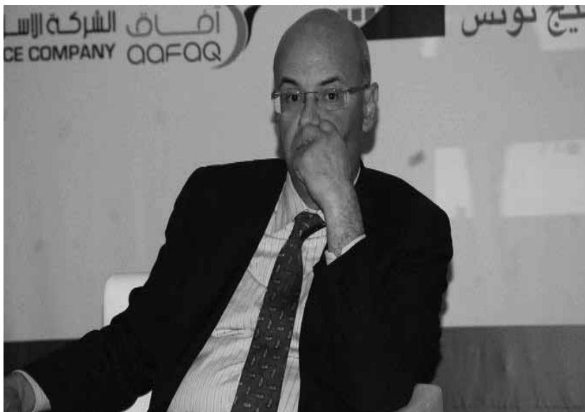
HAKIM BEN HAMMOUDA Ministre de l'Économie et des Finances de Tunisie

(ANALYSE DE LA LOI DE FINANCES COMPLÉMENTAIRE 2014)